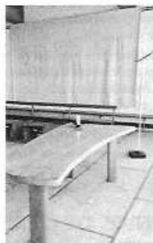
Th.Gleb 1971- « Signes d'amour »