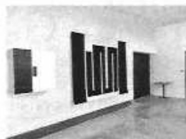
Cohésion entre tapisserie et architecture