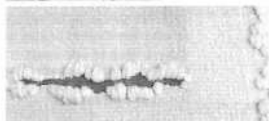
J.GRAU-GARRIGA-1986 détail "Hores de llum i de foscor"